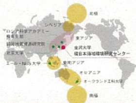
本プロジェクトのネットワーク拠点と観測地域

近年、PM 2.5 や黄砂などの有害な粒子の発生が深刻化しています。さらに、その粒子が大気・海洋を通じて越境輸送されることで、ヒトの健康や生態系に広範囲で悪影響を及ぼしており、越境汚染の現状把握が重要視されています。 日本海を取り囲む「環日本海域」の環境問題に多角的なアプローチで取り組む本学環日本海域環境研究センターでは、東アジアの研究機関との研究ネットワークにより、PM 2.5 に含まれる有害有機物「PAH類」の越境輸送とその影響評価に関する共同研究を展開しています。本プロジェクトは、このネットワークを基盤に、北極・シベリアから南極を結ぶ「太平洋西部縁辺海域」に連携体制を拡大。各観測地における大気・海洋中のPAH類濃度の経年観測や観測データの比較分析などを行い、越境輸送のメカニズムや環境影響の実態を把握します。さらに、PAH類がヒト・生態系に与える影響について、医学研究者との人体の健康影響に関する共同研究や、各観測地の沿岸域に生息する生物を対象としたPAH類の濃度観測などを通して、地域ごとの特色や経済・産業構造との関連性を探ります。本プロジェクトにより、環日本海域環境研究センターの機能を一層強化し、地球規模の大気・海洋汚染の解明に導く世界的な研究拠点を目指します。