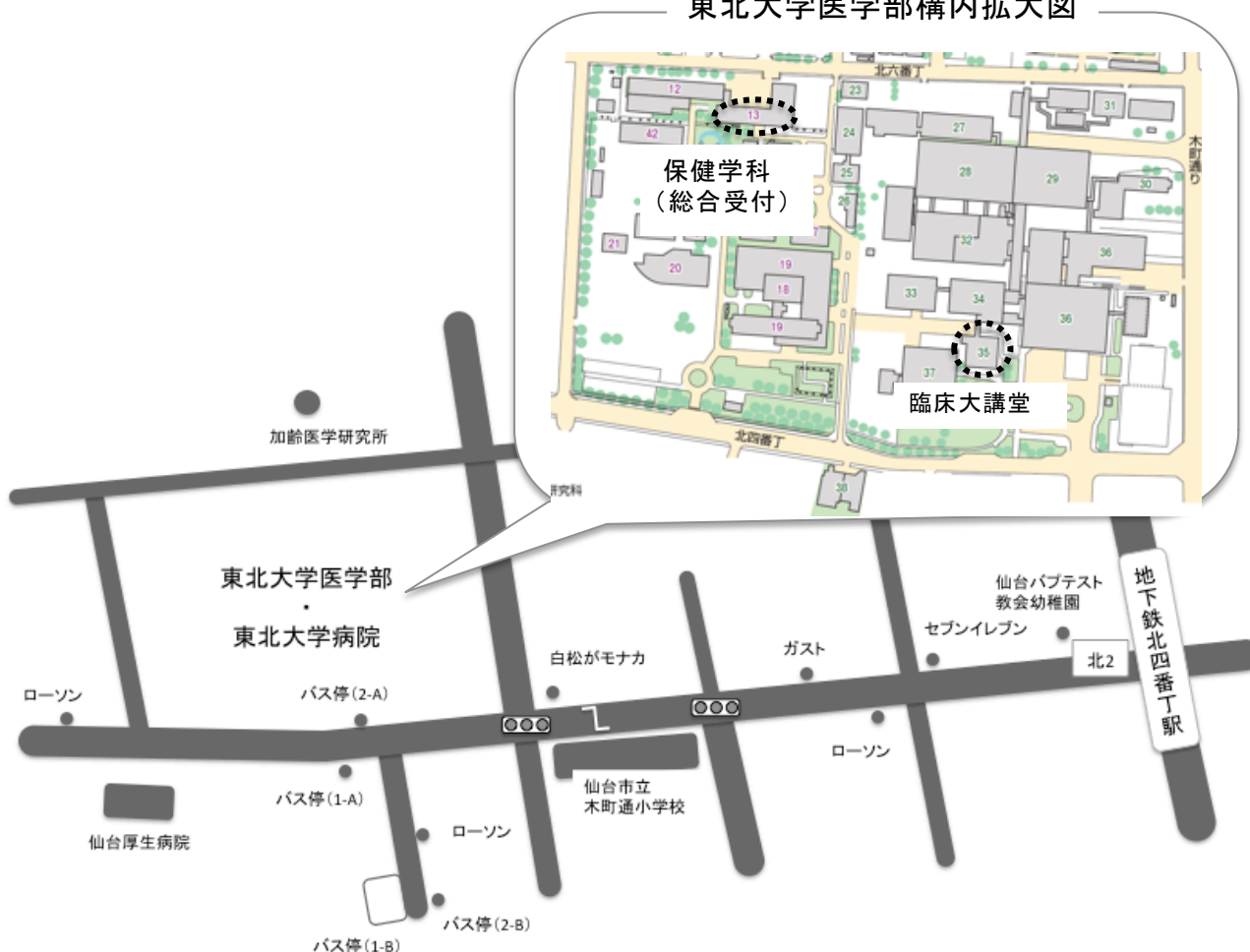
東北大学医学部構内拡大図

〒980-8575 仙台市青葉区星陵町 2-1 http://www.med.tohoku.ac.jp/access/index.html