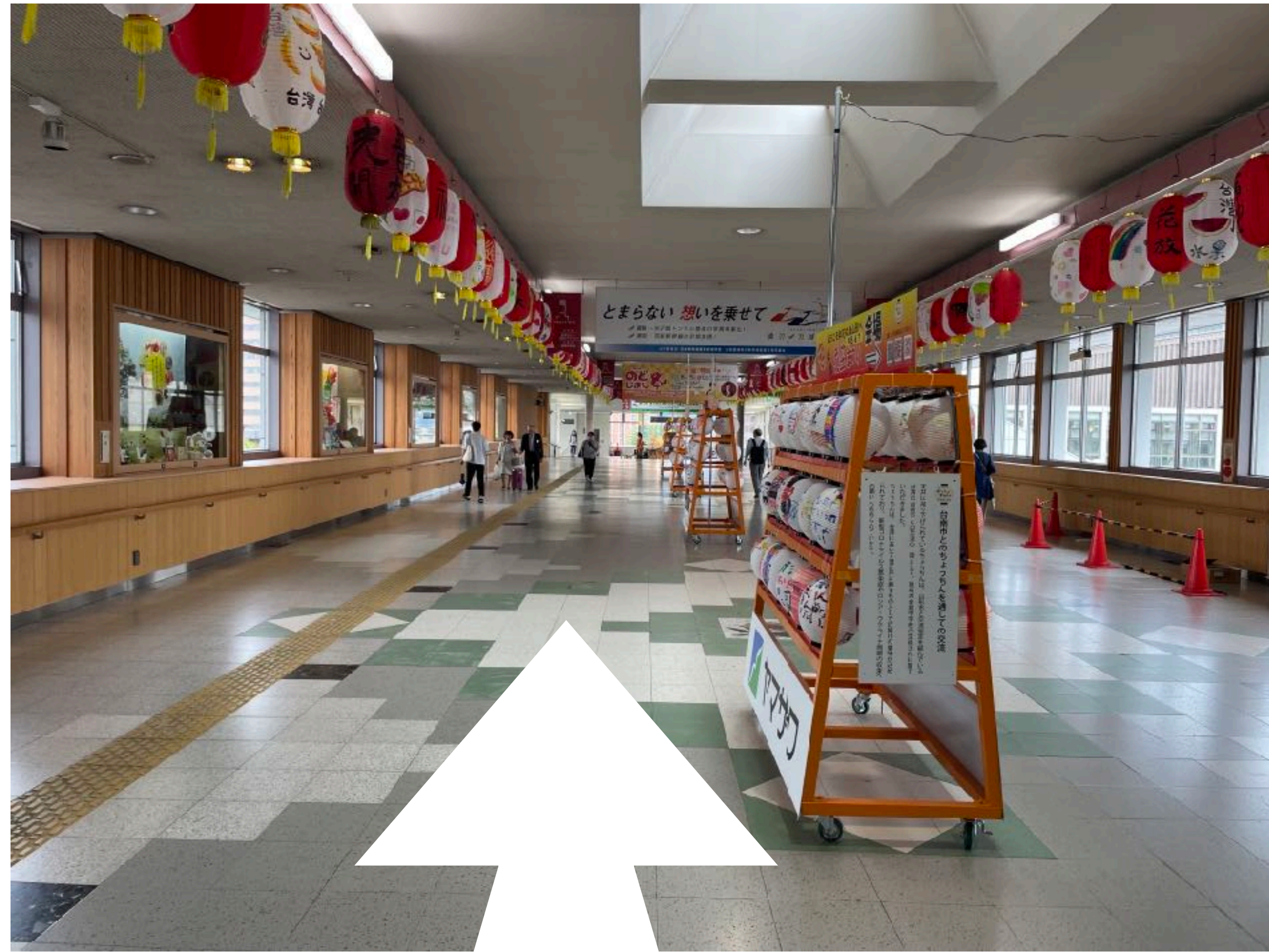
改札左側の突き当たりまで直進