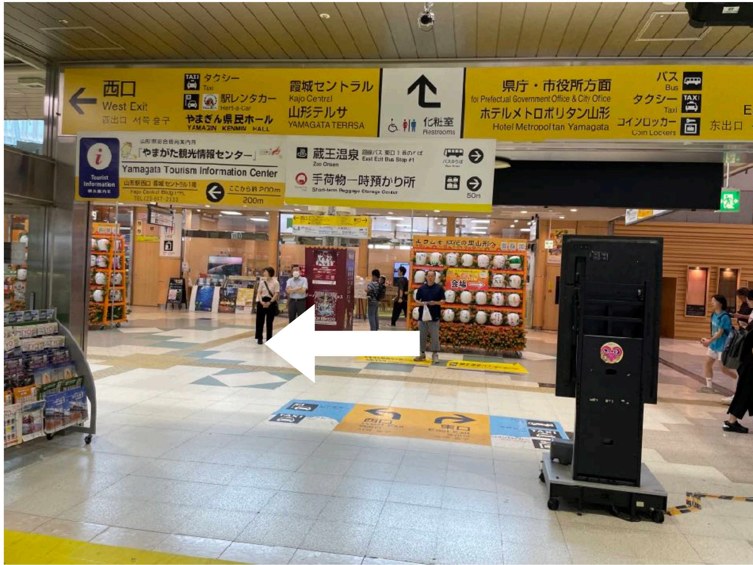
新幹線の改札を通り 在来線の改札へ（1ヶ所）