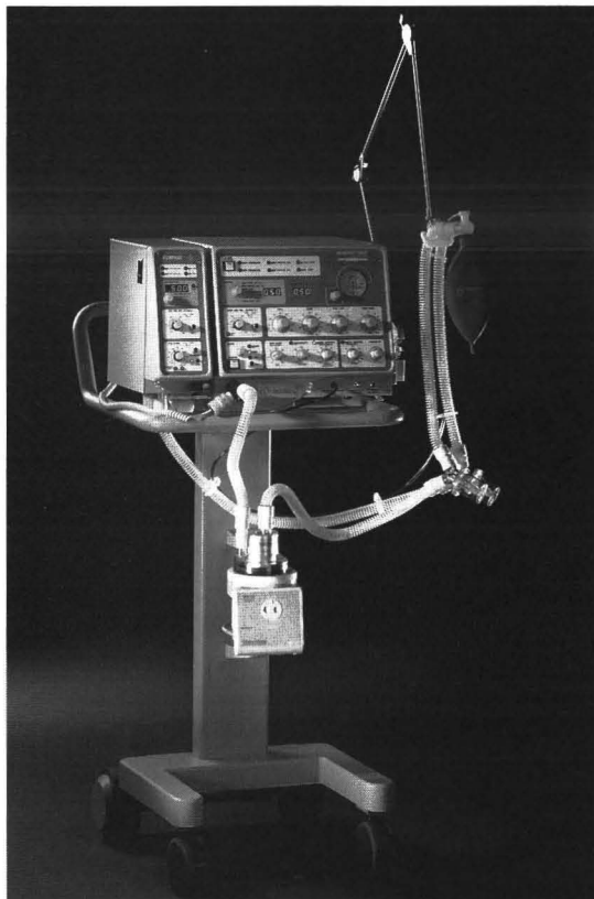
◎コンパスを使用するにはニューポートE200の専用カート (Cat. No. CRT200A) が必要になります。

コンパスVM200はニューポート・ベンチレーター モデルE200 “ウェーブ” 専用開発された呼吸 換気量、吸入酸素濃度モニターです。 E200本体横に取り付けるだけで簡単に使用 できます。