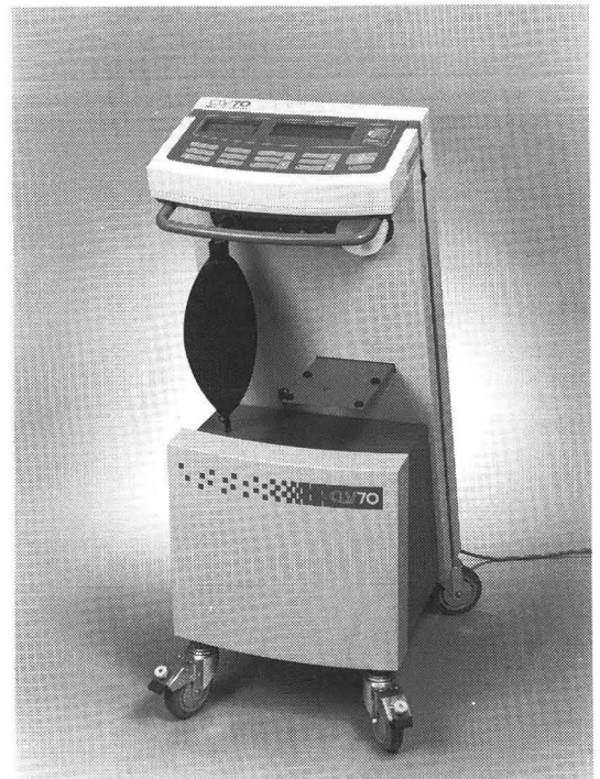
アイカ・ラングベンチレーターCLV70

もちろん、呼吸器としての基本的な性能は充分であり、高齢者の開心術後の呼吸管理であっても、高度の呼吸不全合併例などの特殊な例以外は、CLV70で充分と思われる。