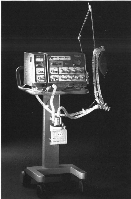
○コンパスを使用するにはニューポートE200の専用カート (Cat No. CRT200A) が必要になります。

コンパスVM200はニューポート・ベンチレーターモデルE200“ウェーブ”専用開発された呼吸換気量、吸入酸素濃度モニターです。E200本体横に取り付けるだけで簡単に使用できます。