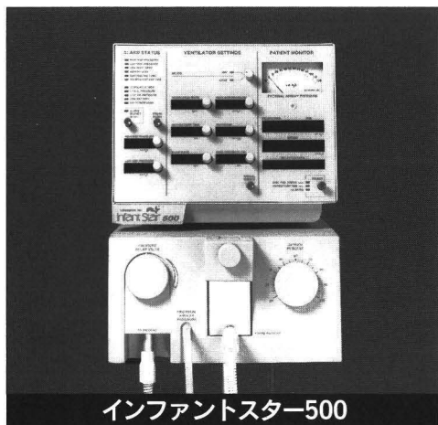
インファントスター500

小児用人工呼吸器の普及タイプです。IMV、CPAPに加え、オプションのスターシンの追加によりSIMVモードの使用も可能です。