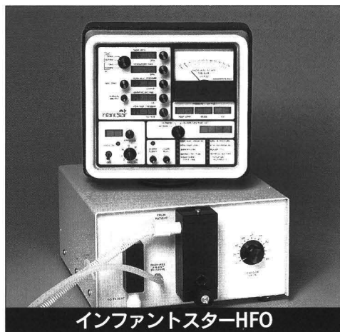
インファントスターHFO

普及タイプの200の機能に加えて、マイクロプロセッサコントロールにより、様々な機能、特徴を有したコンベンショナルタイプの傑作です。