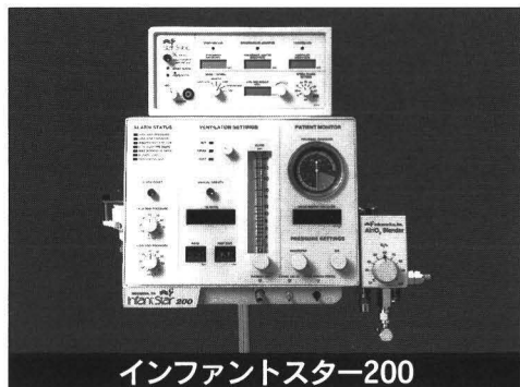
インファントスター200

内蔵バッテリーで6～8時間作動可能なトランスポート用です。使用場所は院内、院外を問わず、救急車両への搭載用としても最適です。