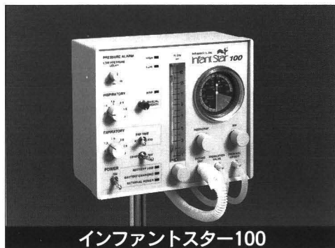
インファントスター100

米国インフラソニックス社のインファントスターが4器種になり、 目的に合わせてご使用いただけます。