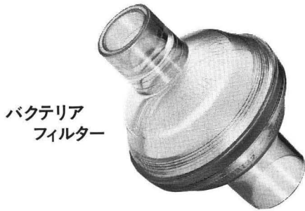
バクテリア フィルター