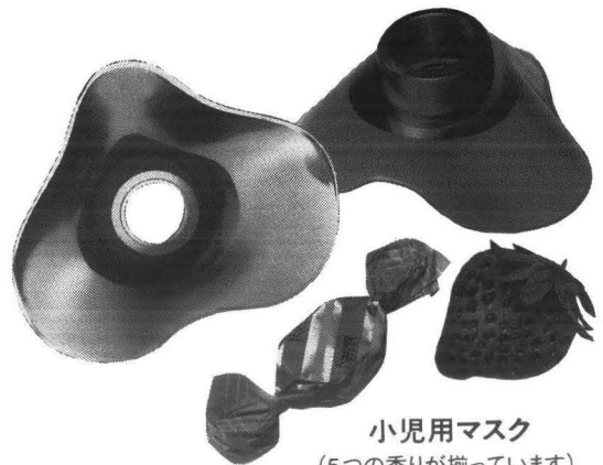
小児用マスク (5つの香りが揃っています)