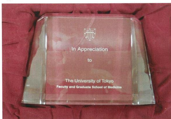
材質:アクリル 幅約16cm 高さ約11.5cm 厚み約4cm