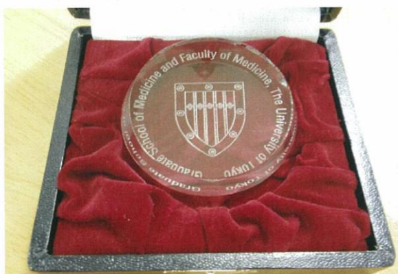
材質:光学ガラス 直径約7cm 高さ約2cm