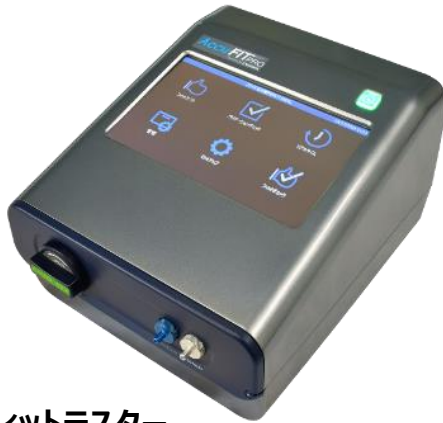
マスクフィットテスター AccuFIT 9000® PRO