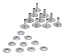
プローブキット(100set) Model 3000-63