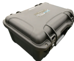
ハードケース(PRO用) Model 3000-78