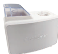
粒子発生器 Model 3000-80