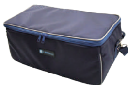
ソフトケース Model 3000-79