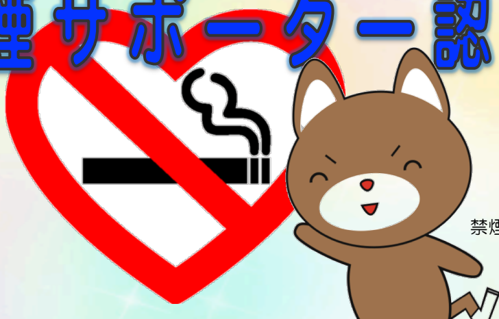
禁煙推進キャラクター すわんけん