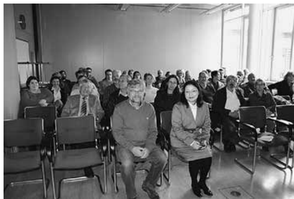
ミュンヘンでの会合