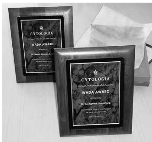
第1回と第2回の和田賞の記念プレート

First Report of Chromosome Analysis of Saddleback Anemonefish, Amphiprion polymnus (Perciformes, Amphiprioninae), in Thailand. Alongklod Tanomtong, Weerayuth Supiwong, Arunrat Chaveerach, Suthip Khakhong, Tawatchai Tanee, La-or Sri Sanoamuang CYTOLOGIA Vol. 77 (2012) No. 4, 441–446.