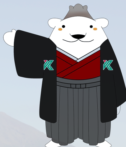
鹿児島大学公式マスコットキャラクター