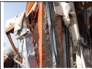
図4 吹付ロックウール、アスベストはなし