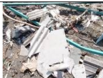
図3 確認された波型スレート、アスベスト建材