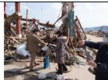
図2 瓦礫の目視による評価、環境測定の様子

2011年4月10日午後、南三陸町、4月11日（日）午前気仙沼、本郷交差点周辺市街および3月11日～12日に火災に見舞われた鹿折地区実地で、瓦礫等に含まれる目視による調査を行った。特に、アスベスト含有している可能性のある建材や断熱材（ボイラー及び加熱容器、セメントパイプ、電線用線渠、パイプ被覆、屋根材、ダクト及び家屋の断熱材、耐火板、炉の断熱パッド、床タイルや床シートの下敷き等）がないか実地調査を行った。図2は南三陸町志津川地区における調査の様子である。図3瓦礫のなかに含まれていた波型スレート、アスベスト含有建材、図4は吹付ロックウールである。2011年4月11日に図4に示した吹付ロックウールを偏光顕微鏡で確認したところ、石綿繊維は確認されなかった。