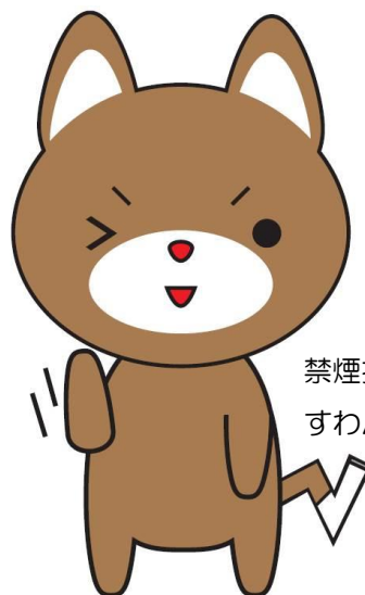
禁煙推進キャラクター すわんけん

お蔭様で、第2回「健康寿命をのぼそう!アワード」において厚生労働省健康局長優良賞を受賞致しました