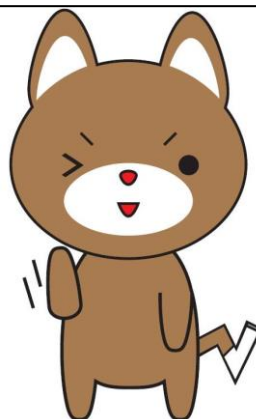
禁煙推進キャラクター すわんけん