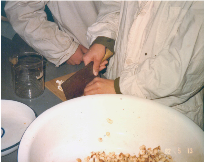
図3 炮製学実習：シヨウガ汁で煮るまえに水でもどした半夏をカット（北京中医学院 一九八二）

以上のように、中国の炮製はおもに毒性・副作用の緩和と、効果の増強・改変を目的としている。しかし、その必要性や有効性がうたがわしい薬材もある。