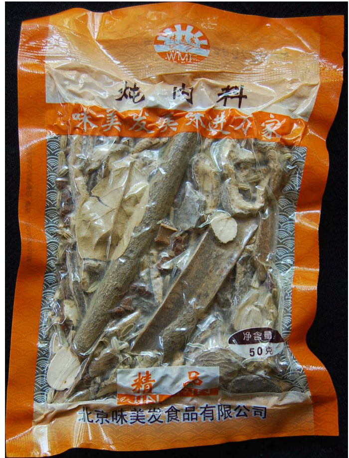
図1 北京で市販の炖肉料パック