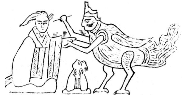
図2 針医画像石の模写（『山東中医学院学報』1981年 第3期より）

両城山画像石……針医をえがいた約二世紀前半の漢代画像石が山東省微山県の両城山から八点ほど出土し、同地からは紀元一三〇・一三七・一三九年の年代を刻む画像石も出土している（拙論「人面鳥身の針医—二世紀の画像石から—」『漢方の臨床』四一巻四号、一九九四年）。様式はほぼ一致し、上半身はヒトで下半身はトリの針医が、頭髮をたらしただ病人を脈診し、もう一方の手で砭石を病人にかざす。砭石ではなく、右手に細ながい金属針をもち、病人の頭部や手に多数の置針をえがく画像石（図2）もある。伝説の名医・扁鵲の「鵲」はカササギで、扁鵲と砭石は同音関係にあり、『史記』の伝では山東と関係がふかい。人面鳥の針医画像石も山東しか出土例がないので、扁鵲伝説と関連するかもしれない。