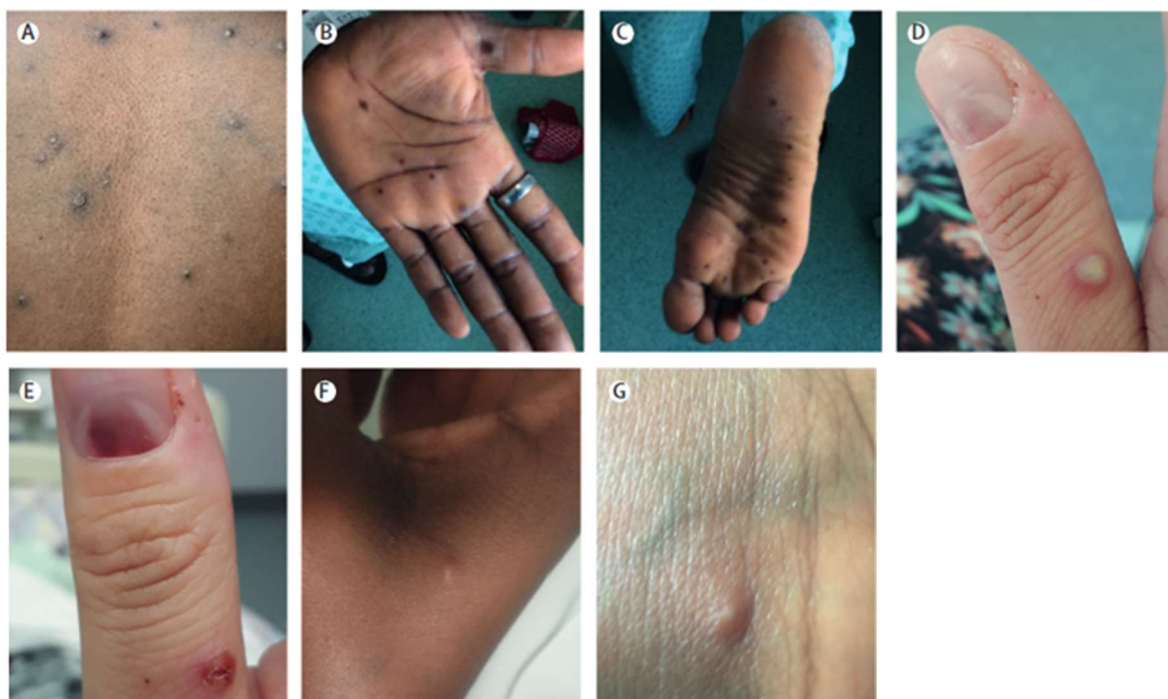
A : 小水疱、B, C : 手掌、足底の斑点状の皮疹、D : 膿疱と爪下病変、E : 爪下病変、F, G : 小丘疹、小水疱 (文献 1)

顔面 (95%)、手掌、足底 (75%) に好発する。発疹の経過は 10 日程度で、斑点状→小水疱→膿疱→痂皮と経過をたどる。発疹が多く発生する部位として、多い順に、顔 > 脚 > 体幹 > 腕 > 手掌 > 生殖器 > 足底が挙げられる 1 。口腔粘膜や結膜、角膜にも発症した例が報告されている。痂皮は 3 週間は完全に消失しないことがあり、結痂 (けつか) が乾燥して痂皮になり、剥がれ落ちると感染力はなくなる 2 。