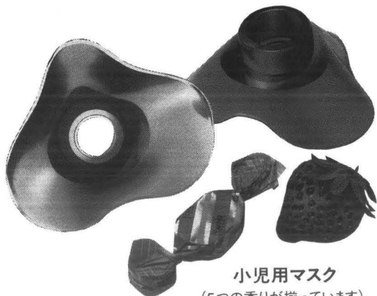
小児用マスク (5つの香りが揃っています)