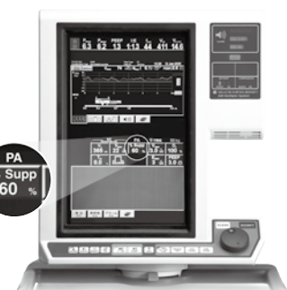
840 PAV+ / NIV