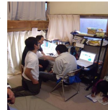
診察風景です。 (朝五時に来所されました) →