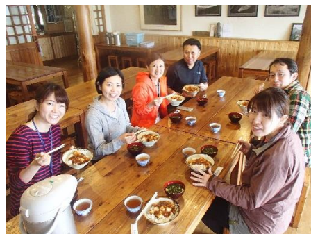
←山小屋での食事風景です。