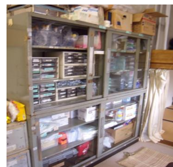
←処置のための医療物品です。