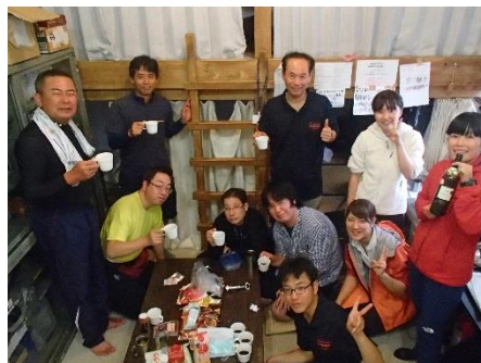
一日の最後は飲み会で(必須ではありません) ↓