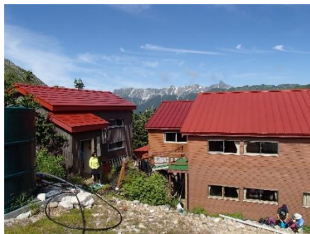
↑診療所の外観です