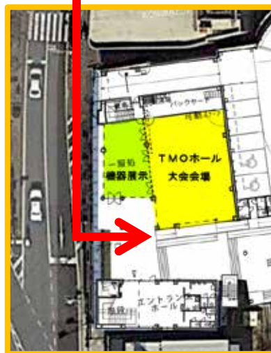
三島商工会議所1階 大会会場アクセス図

お車でお越しになる方へ 会場に駐車場が併設されておりますが、会期 期間すべて入出庫なく連続駐車していると割 高になります。(夜間の定額設定なし) 連続駐車の場合は駅付近のTimesなどをご利 用になるか、宿泊先ホテルにご相談いただ 方がよろしいかと存じます。