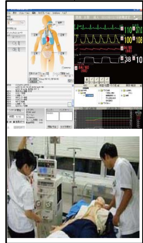
PCAS シミュレーション