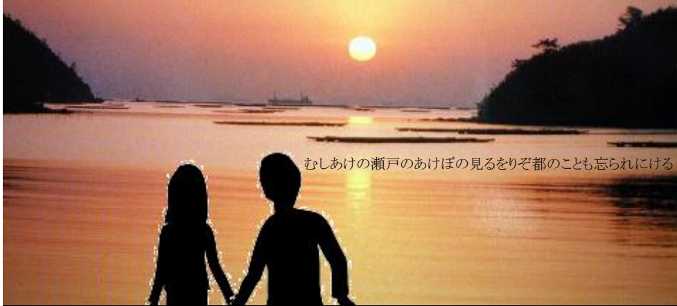
むしあけの瀬戸のあけぼの見るをりぞ都のことも忘れにける